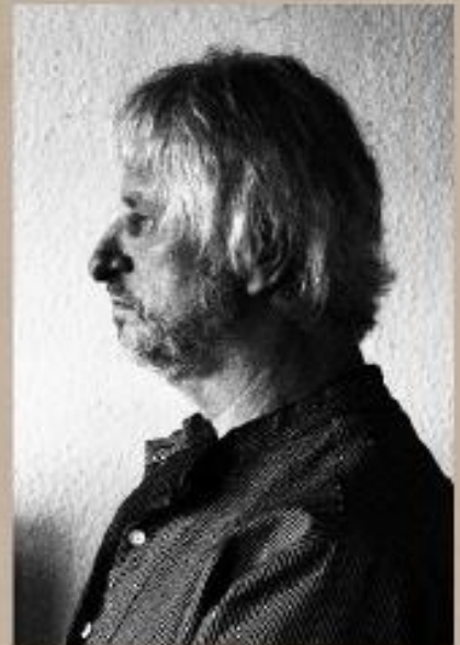
Arne Spekat Musik & Klänge